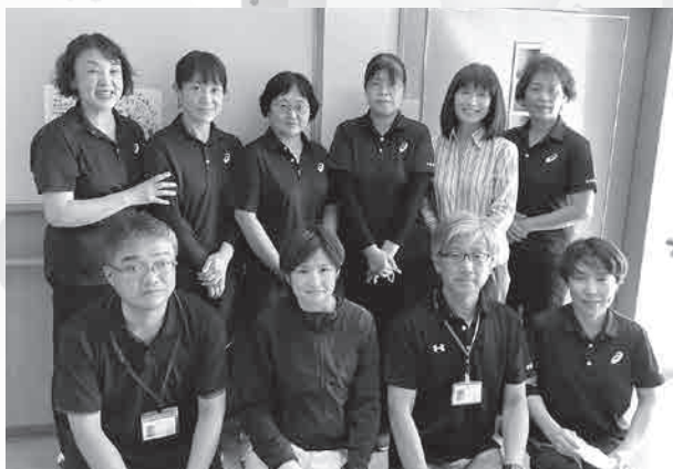
香南市社会福祉協議会 役職員一同

役職員一同、これからも皆様と一緒に暮らしやすい地域づくりを目指し、頑張って参りますので今後ともよろしくお願いいたします。