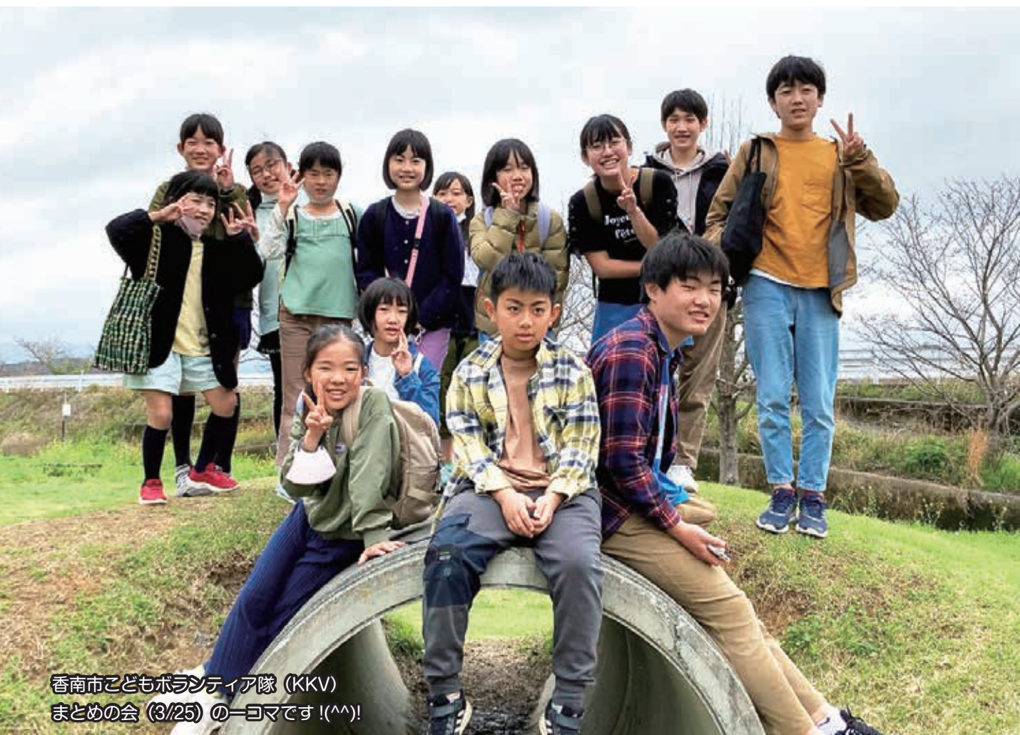
香南市こどもボランティア隊 (KKV) まとめの会 (3/25) の一コマです! (^ ^ )!