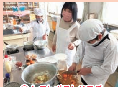
② トマトポテトサラダ