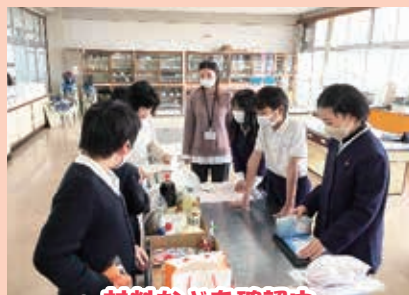
～材料などを確認中～