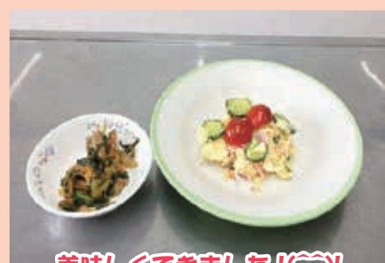
美味しくできました!(^^)!