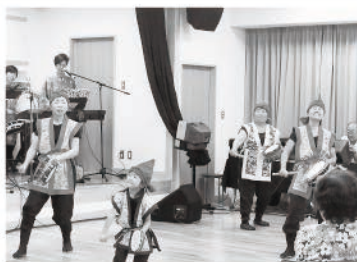
高知県沖縄三線愛好会の三線とエイサー

野市町・市体育大会では 毎年お世話になっている 音響・司会・競技説明の 皆さま方