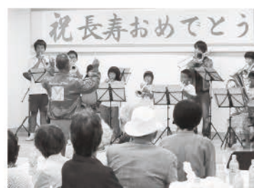
よしかわキッズプラス