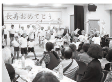
吉川小学校児童のダンス

9月29日（土）、75才以上の敬老対象者の方々を地域でお祝いしようと、吉川町敬老会実行委員会主催で、敬老会が開催されました。会場で会った旧友たちとのお話や、アトラクションで楽しんでいただきました。