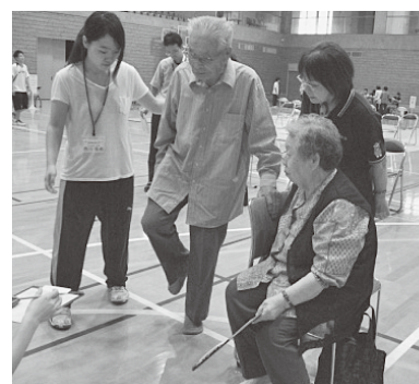
運動の秋。体力テストに参加。