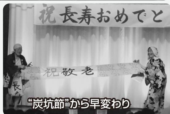
“炭坑節”から早変わり