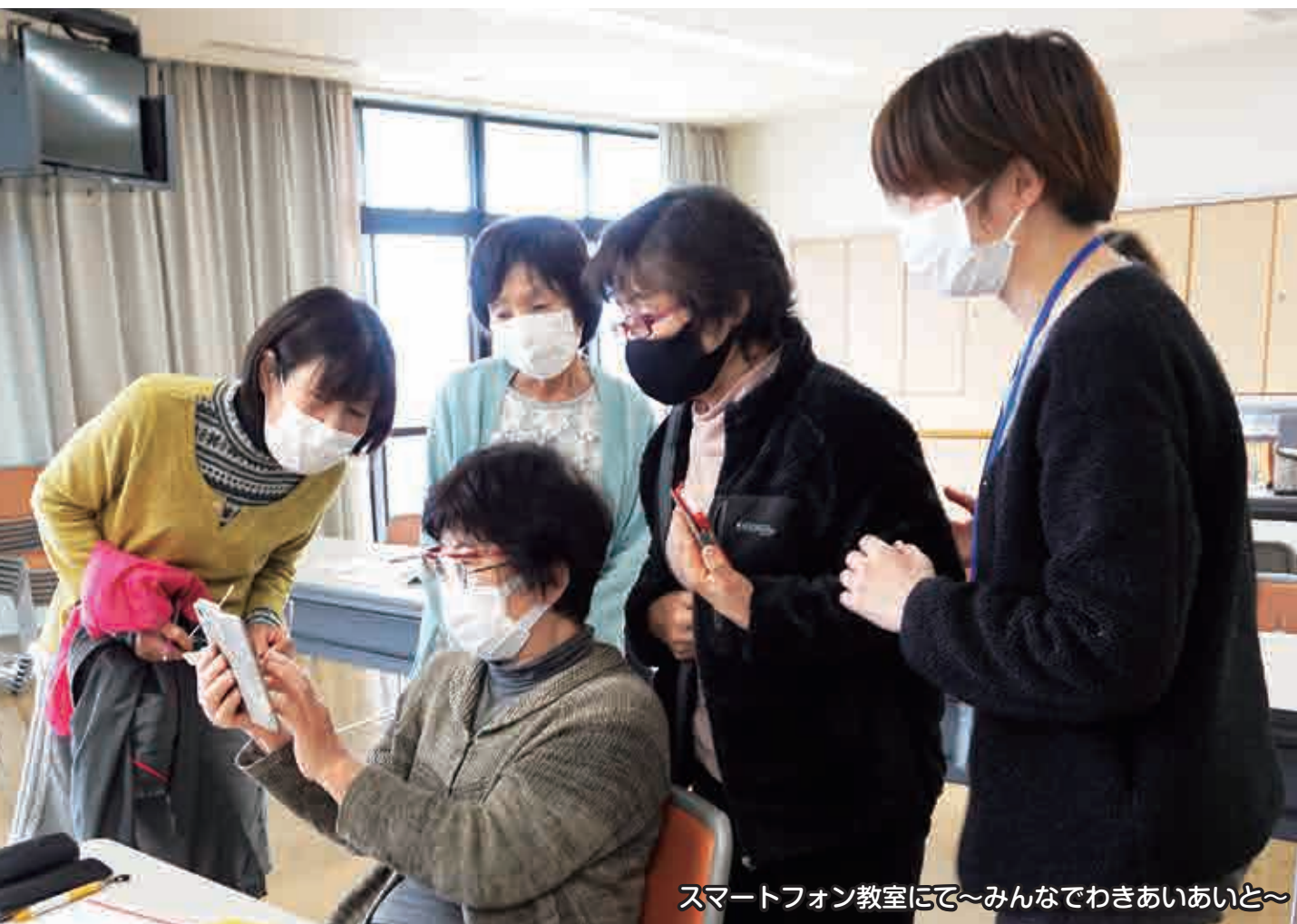
スマートフォン教室にて～みんなでわきあいあいと～