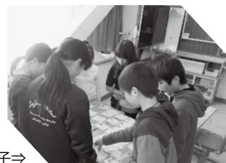
認知症よりそいかるたとりの様子⇒

児童からは、「認知症の人の気持ちを考えたことなかったけど、考えるいい機会になった」「認知症になっても「大丈夫だよ」と助けたい」との声を聞くことができました！